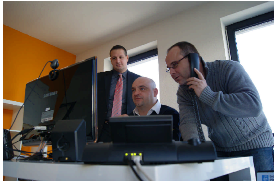
Der „Echt-Test“ gehört immer zum TMR Service

weitere Unternehmensstandorte gründen, dann können sogar Verbindungskosten eingespart werden, da