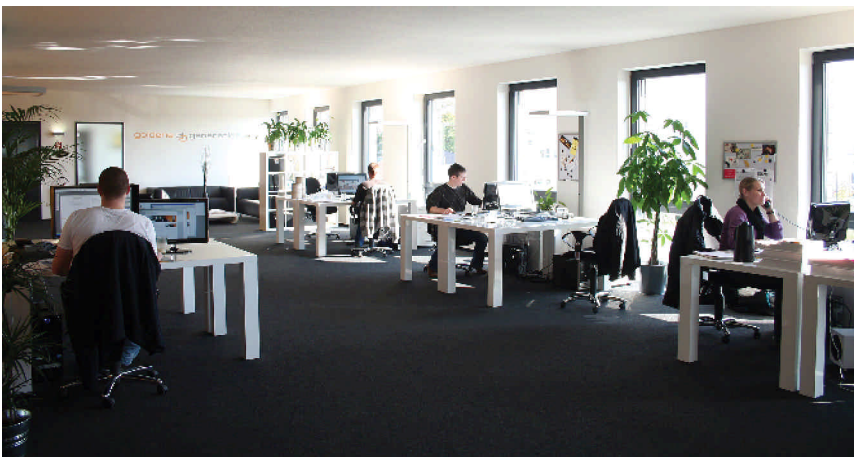
Die „Agenten“ der Goldenen Generation

firmeninterne Gespräche nicht mehr über das Telefonnetz, sondern über eine bereits vorhandene Datenverbindung zwischen den Niederlassungen geführt würden.