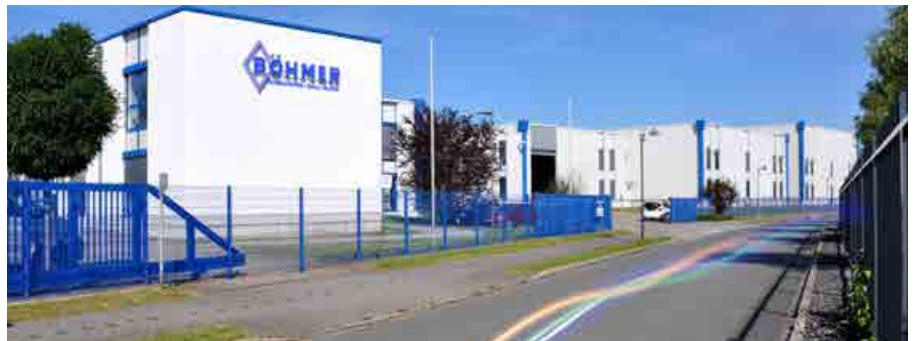
Best Practice: Böhmer GmbH auf der Henrichshütte

Da wir unser Stammwerk in Sprockhövel aufgrund der umgebenden Wohnbebauung nicht mehr erweitern konnten, haben wir 1999 einen Teil der Fertigung sowie Akquisition und Vertrieb nach Hattingen ausgelagert. Anfangs konnten wir unser standortübergreifendes ERP-System mit zwei bestehenden ISDN-Leitungen betreiben. Bei der Suche nach einem neuen zeitgemäßen ERP-System aber haben wir gemerkt: Wir brauchen Bandbreiten ganz anderer Dimension.