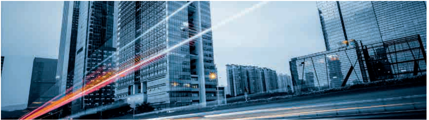
Glasfaseranbindung mit symmetrischen Bandbreiten für einen Internetzugang oder im Rahmen einer Standortvernetzung von Unternehmen auf der Henrichshütte

Im Gewerbe- und Landschaftspark ist die positive Entwicklung augenfällig, denn die Stadt Hattingen trat hier nach der Schließung der Henrichshütte Ende der 1980er-Jahre ein schweres Erbe an. Heute ist von dem ehemaligen Stahlwerk nur noch ein kleiner Teil als Museum und Veranstaltungsort geblieben. Daneben tummeln sich, eingebettet in gepflegte Grünflächen, auf den 140 Hektar des ruhrnahen „Hüttenparks“ rund 90 Betriebe mit über 2.000 Beschäftigten.